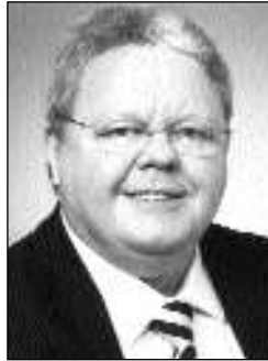
Uwe Döring ist Minister für Justiz, Arbeit und Europa des Landes Schleswig-Holstein